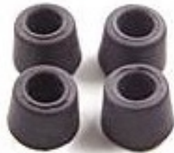
4 Pieds à visser pour coffrets SJ5009 (0,50 €)