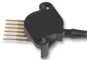
1 capteur MPX4250AP