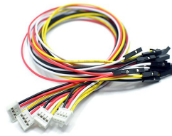
1 cable pour grove/picot femelle - 30cm